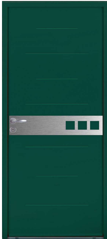
NADARA H.215 x 90 cm