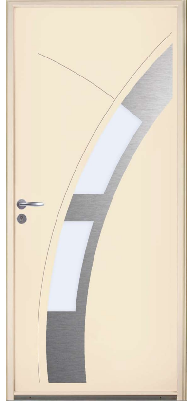
TREJA H.215 x 90 cm