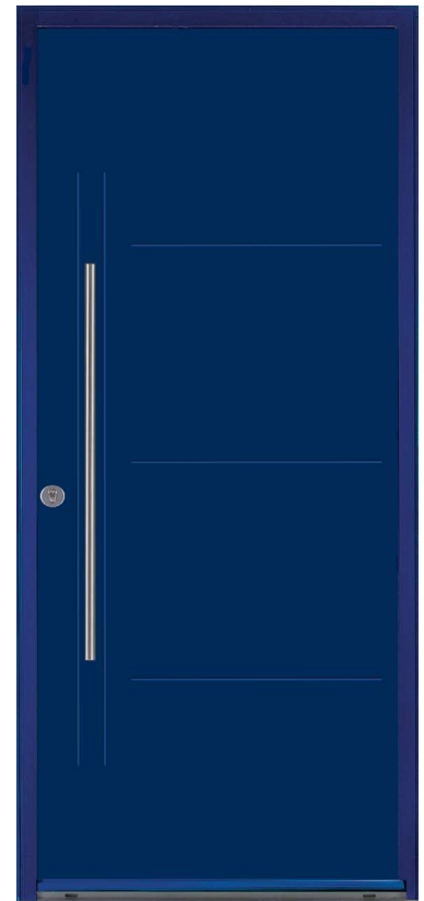
TABOO H.215 x 90 cm