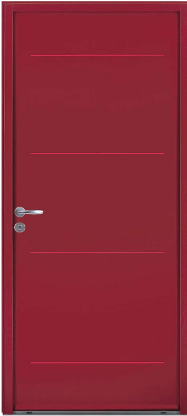
BINIC H.215 x 90 cm

Ouvrant de 52 mm d'épaisseur / Dormant MIXTE 63 mm Aluminium extérieur et Bois intérieur / Seuil Aluminium 20 mm / Joint d'isolation périphérique sur le dormant / Joint double lèvres sur le vantail / Panneaux de porte avec âme isolante en polyuréthane / Serrure 6 points à manœuvre automatique ou à relevage / 4 fiches à réglage tridirectionnel.