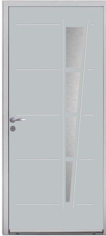
SANGONE H.215 x 90 cm