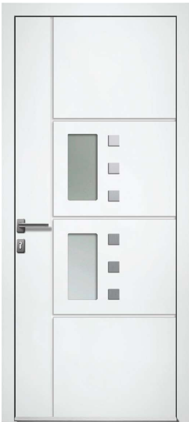
DEBBY H.215 x 90 cm