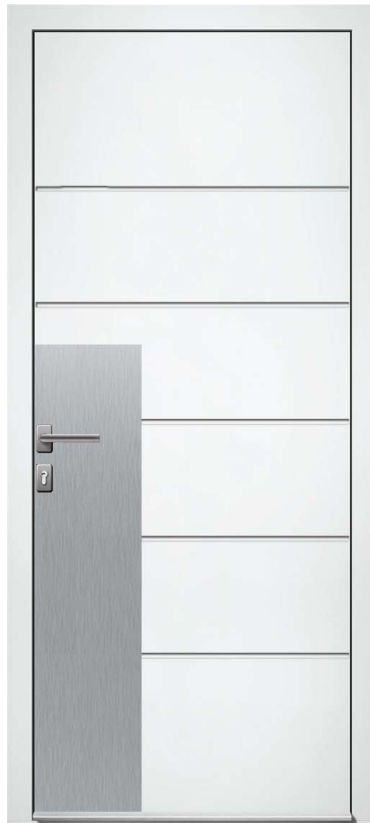
SATURNE H.215 x 90 cm