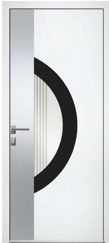
LAURE H.215 x 90 cm