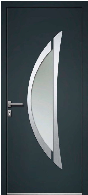
LUNE H.215 x 90 cm

6 points de verrouillage / Barillet sécurisé 5 clefs / Dormant 63 mm / Ouvrant monobloc 75 mm / Seuil anodisé 16,5 mm