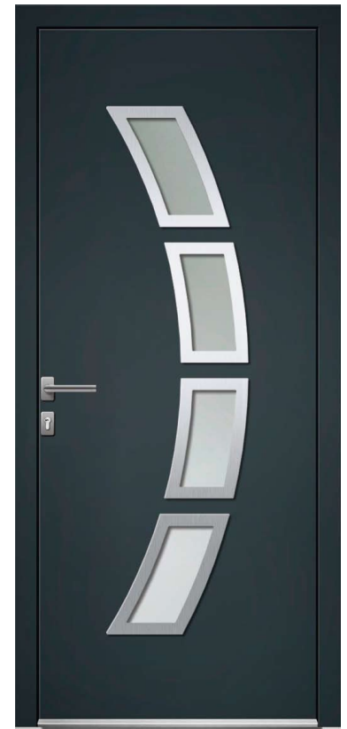
COURBE H.215 x 90 cm