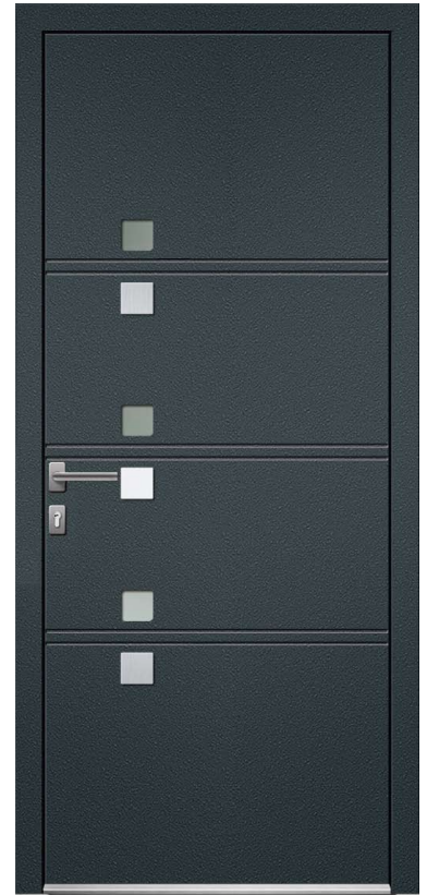
FINE H.215 x 90 cm